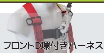
フロントD環付きハーネス

一般的なフルハーネスと同様に背中にもD環が設けられているので、昇降移動時だけでなく通常作業にもご使用いただけます。