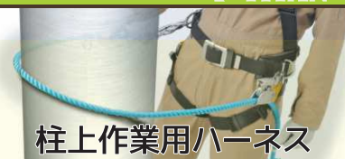
柱上作業用ハーネス

「墜落制止用器具の規格」で、ワークポジショニング用器具を使用する際は、フルハーネス型との併用が求められています。