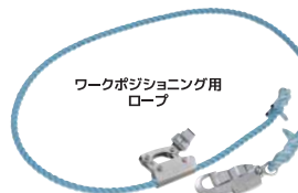
ワークポジショニング用 ロープ